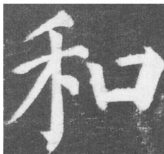
【乙】取自唐代颜真卿《颜勤礼碑》